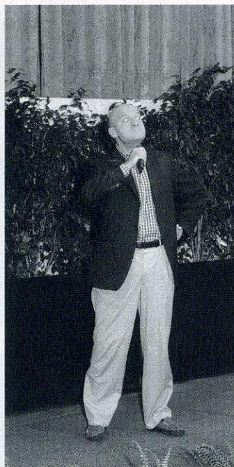
Il cabarettista Claudio Bisio

Abbiamo l'opportunità, oggi davvero inconsueta, di essere indipendenti nella gestione degli affari e di venire apprezzati per i risultati che riusciamo a conseguire. Se proseguiremo su questa strada, se miglioreremo ulteriormente, saremo in grado di dare ai capitali investiti nella Ras la soddisfazione che meritano e potremo continuare a lavorare sereni. L'augurio che faccio a tutti voi e a tutti noi è quindi quello di buon lavoro e di successo”, ha concluso Marchiò.