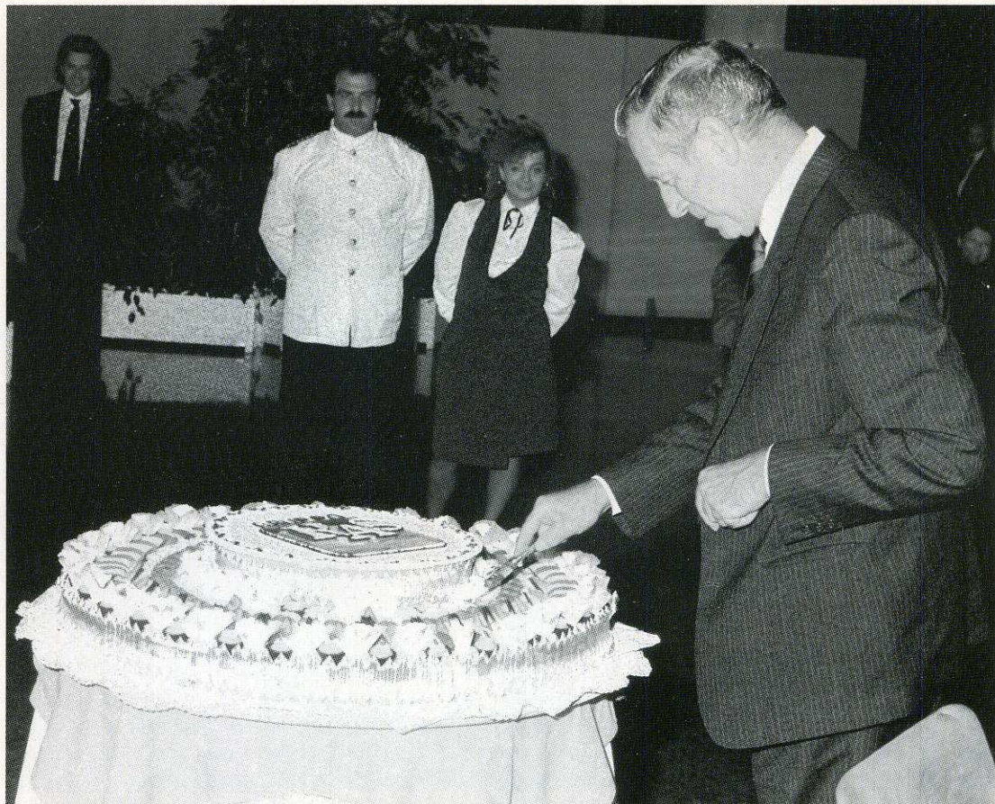
Il taglio della torta.

che l'indice dei corsi azionari ha perso due anni e mezzo nel giro di poche settimane è chiaro che non possono non esserci negativi riverberi sui nostri bilanci.