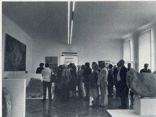
Da sinistra a destra: l'anfiteatro romano e il museo archeologico di Pola, l'imbarco per Brioni, tre immagini del parco naturale dell'isola, il ritorno verso Pola e il rientro a Trieste.