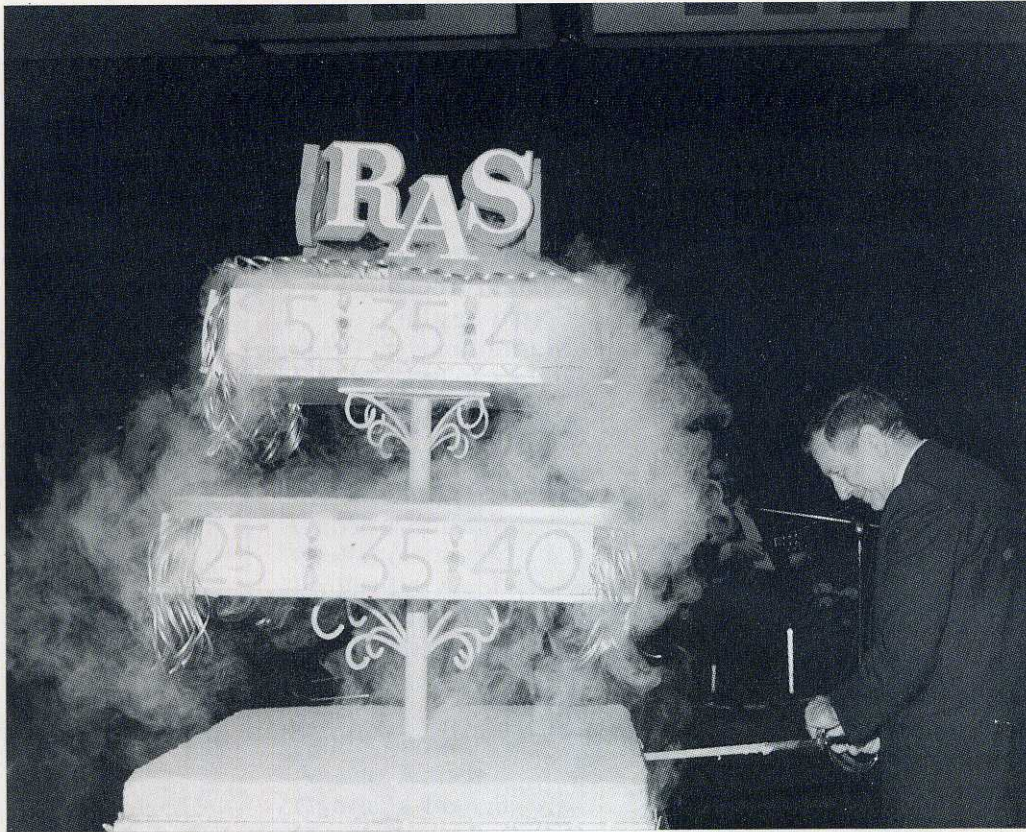
Il taglio della torta alla cena di gala.

uno dei complessi archeologici più suggestivi della romanità, costituito dalle celebri rovine della villa fatta erigere dall'imperatore Adriano.