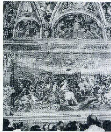
Istantanee del soggiorno romano: a sinistra dall'alto in basso Villa Adriana e Villa d'Este. A destra (dall'alto) il Quirinale, i Musei vaticani e Villa Pallavicini.