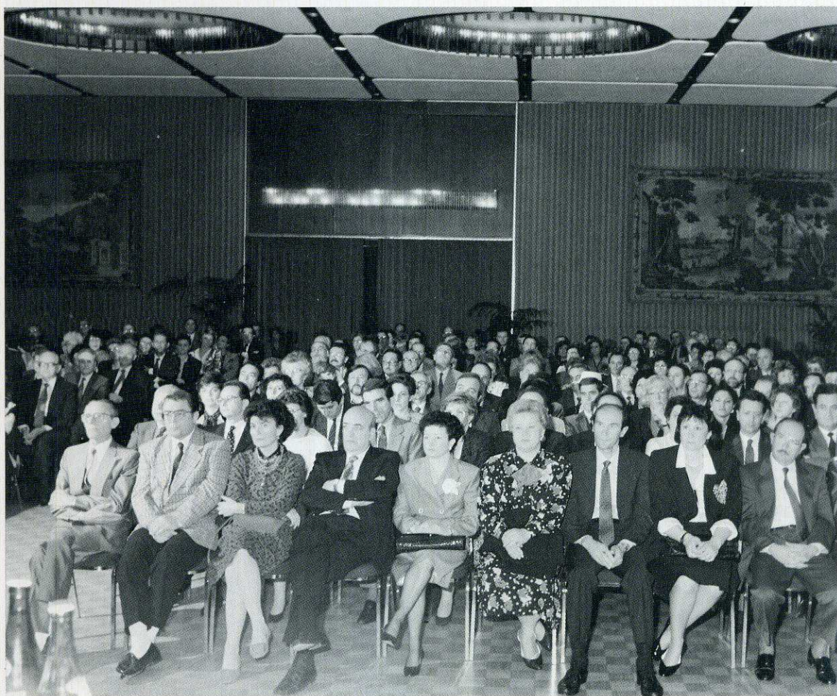
I "fedelissimi" intervenuti alla cerimonia.