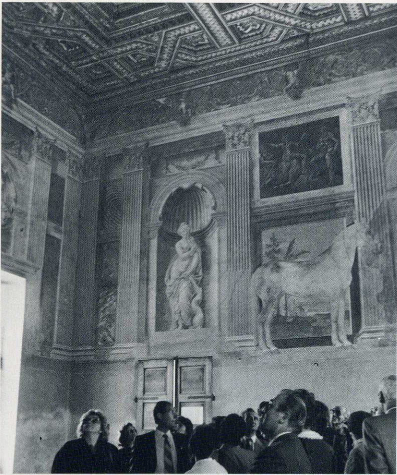
Mantova: in questa pagina due immagini del Palazzo Ducale, nella precedente il cortile del Palazzo Te.