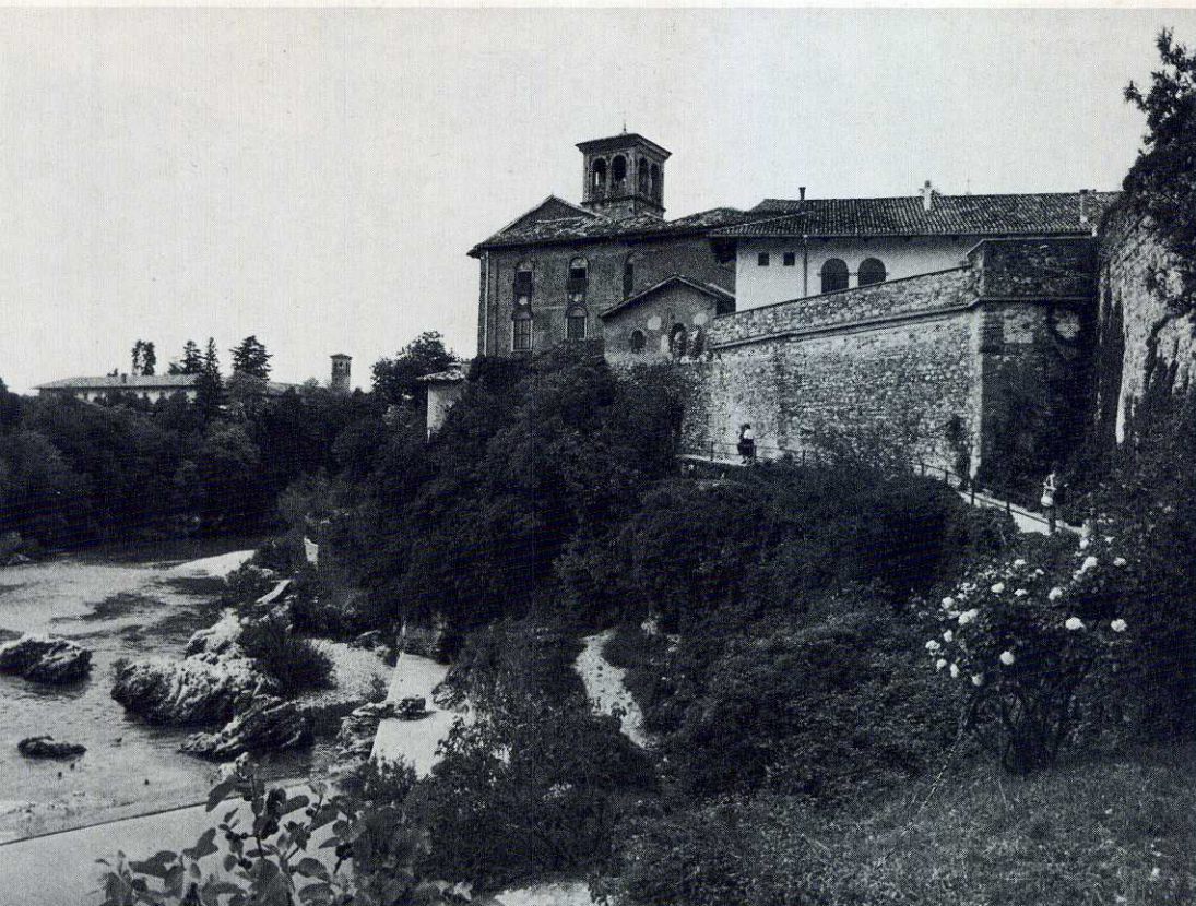
Cividale del Friuli: il fiume Natisone e, sulla destra, il « Tempietto longobardo ».

« anziani » può essere elemento di stimolo e di riflessione specie per le nuove leve.