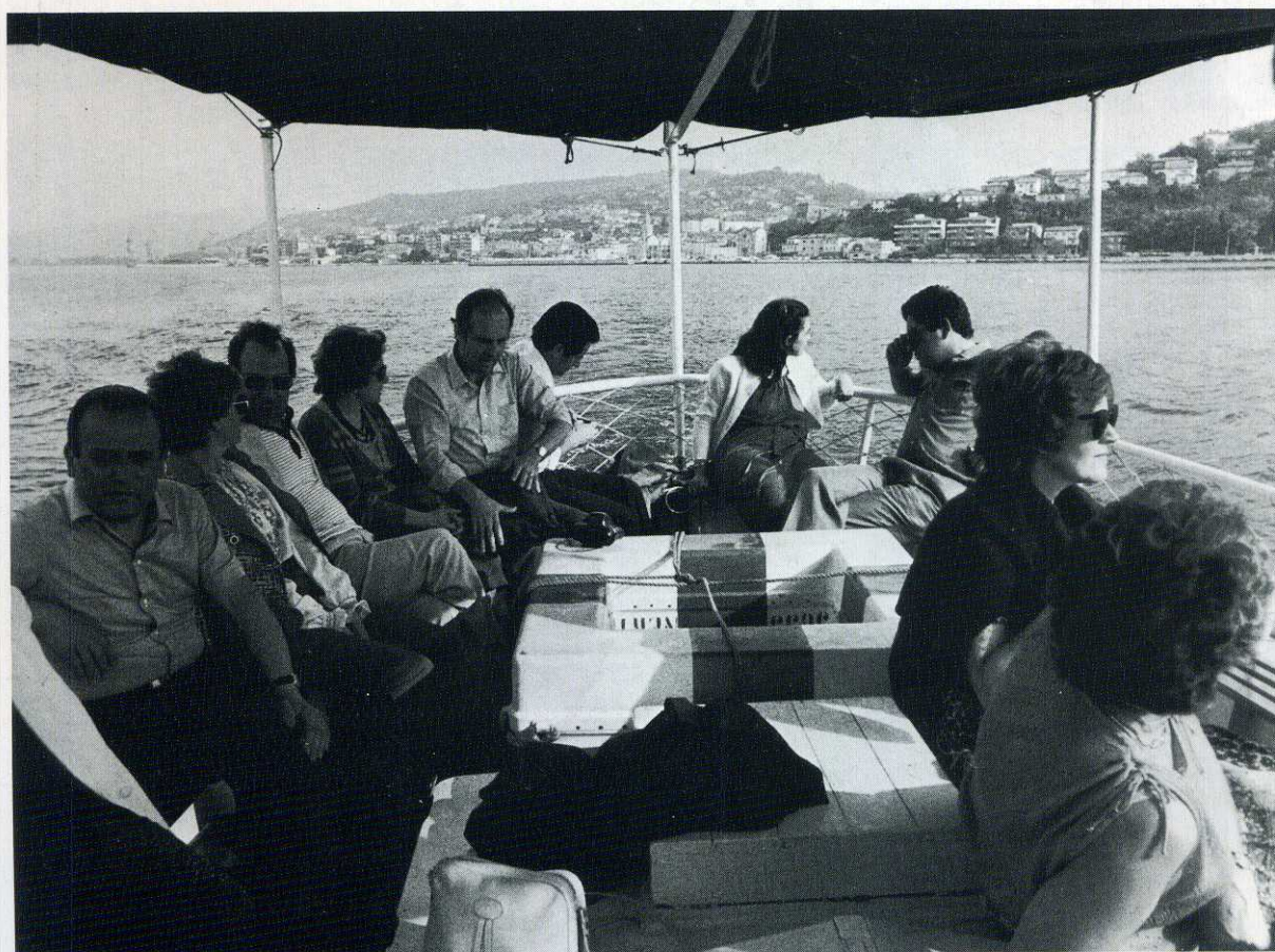
Muggia: il porticciolo.