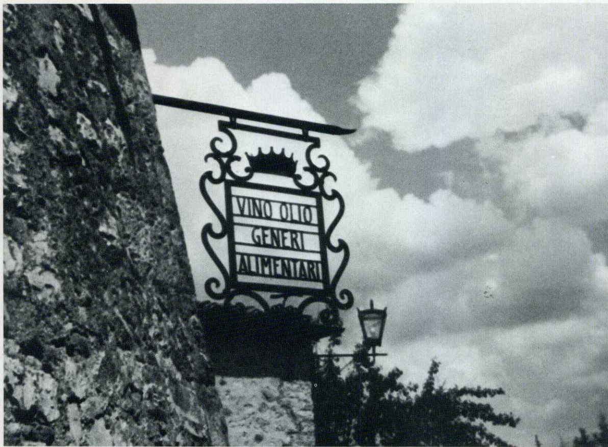
Nel borgo di San Felice tutto parla del buon tempo antico. Nella foto, una caratteristica insegna in ferro battuto e, sullo sfondo, un vecchio lampioncino.