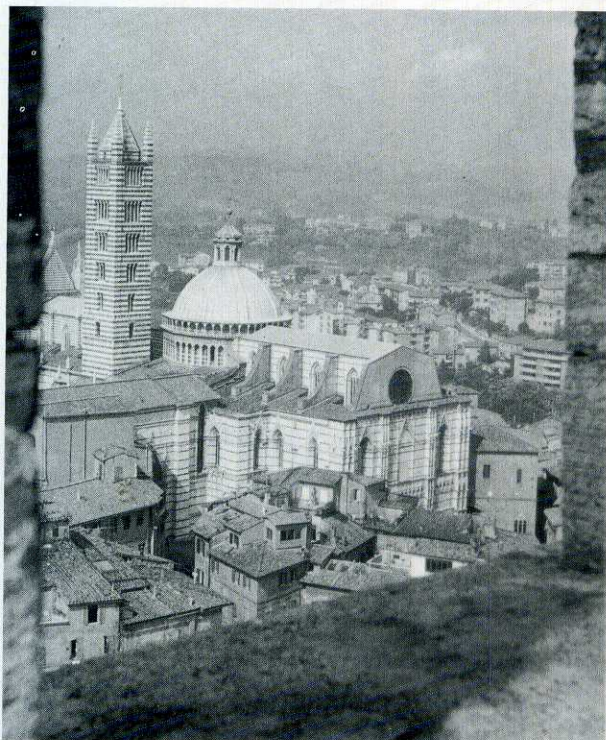
Il complesso architettonico del Duomo visto dalla torre del Mangia.

L'incantevole città toscana è stata la prima meta del viaggio a Roma, dove si è svolta l'annuale premiazione dei dipendenti anziani delle Compagnie del Gruppo RAS.