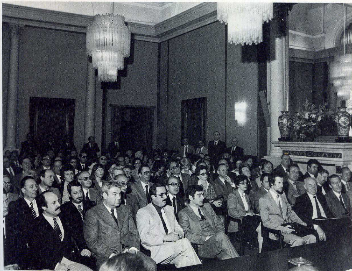
Un'immagine dei partecipanti alla cerimonia di premiazione degli anziani a Roma.

Niente di meglio per concludere degnamente, tra strette di mano e arrivederci, un incontro tradizionale, che conserva, nonostante il rituale e gli aspetti scontati, un'impronta di autenticità.