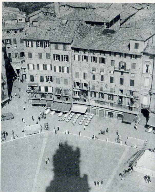
Siena: la torre del Mangia domina con la sua ombra piazza del Campo, dove si svolge due volte all'anno il celeberrimo palio.

Incontro dei partecipanti a Firenze. Visita di San Gimignano. Proseguimento in pullman per Siena. Sistemazione in albergo.